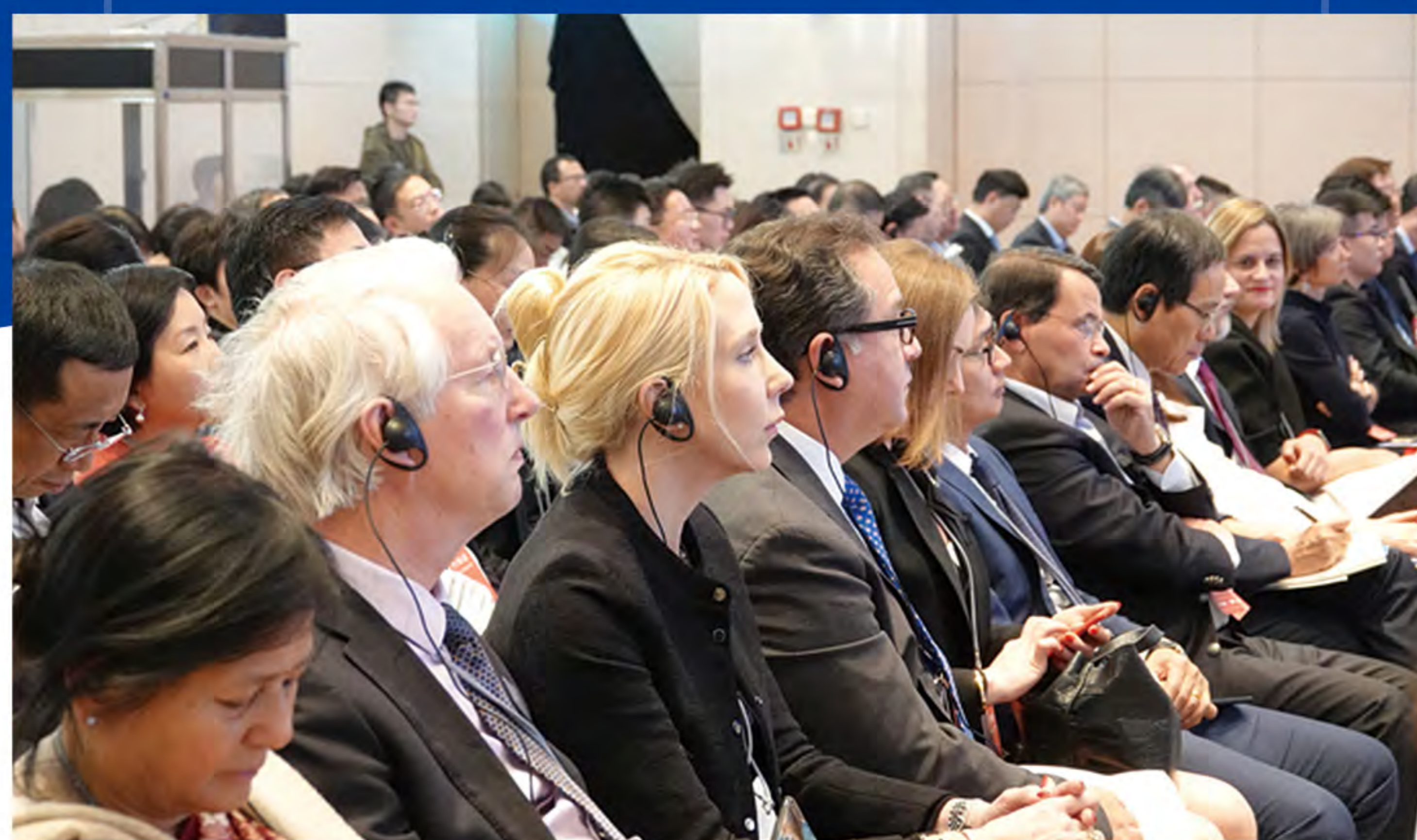
上图: 2019年12月8日“一带一路”律师联盟第一届会员大会第一次会议